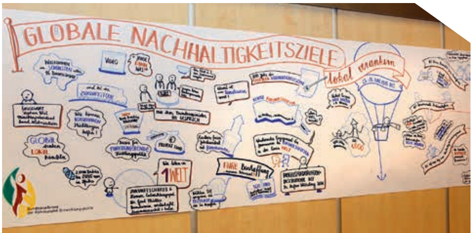
Schaubild zu den Globalen Nachhaltigkeitszielen auf der Bundeskonferenz der kommunalen Entwicklungspolitik in Hannover im Juni 2015

Auf den folgenden Seiten finden Sie einige ausgewählte Beispiele aus der Praxis unserer Entwicklungszusammenarbeit, die zeigen, wie wir zur Verwirklichung der Ziele der 2030 Agenda beitragen werden.